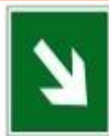
Направляющая стрелка под углом 45°