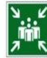
Пункт (место) сбора