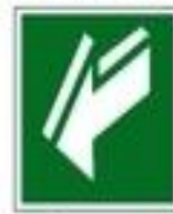
Открывать движением на себя