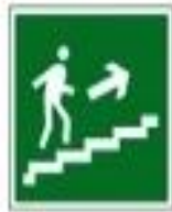
Направление к выходу по лестнице вверх