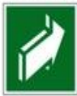
Открывать движением от себя