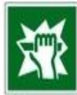
Для доступа вскрыть здесь