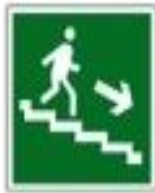
Направление к выходу по лестнице вниз